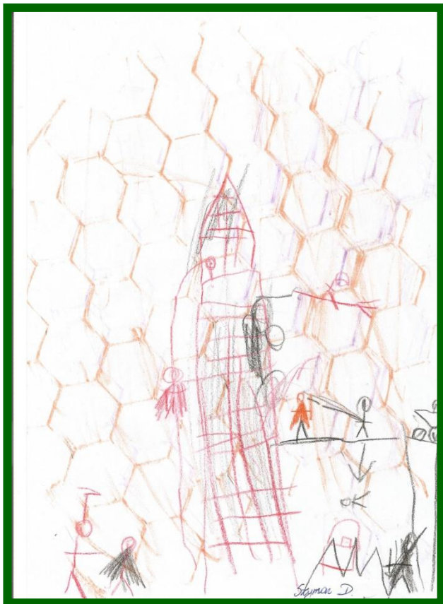
ilustracja: Szymon D.