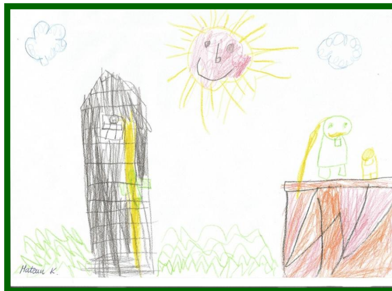
ilustracja: Mateuszek K.